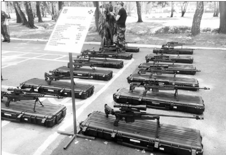
Снайперські гвинтівки підвищеної точності 7.62 бригади оперативного реагування.